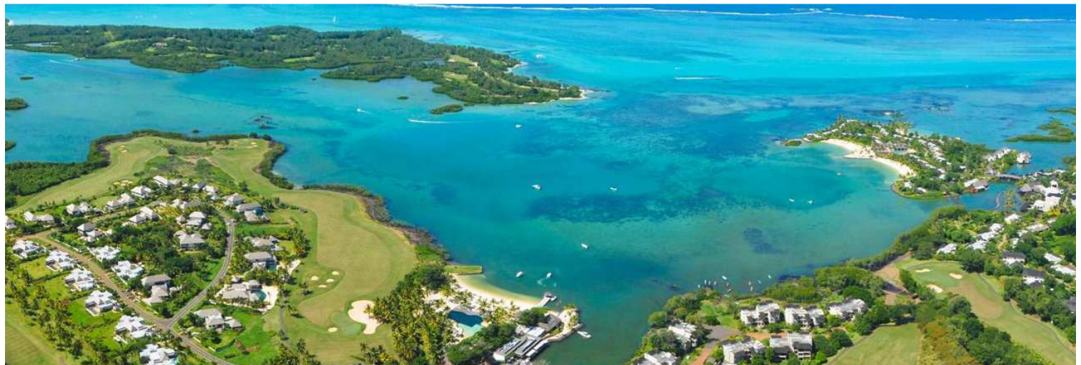
Ile Aux Cerfs Golf & Anahita Golf