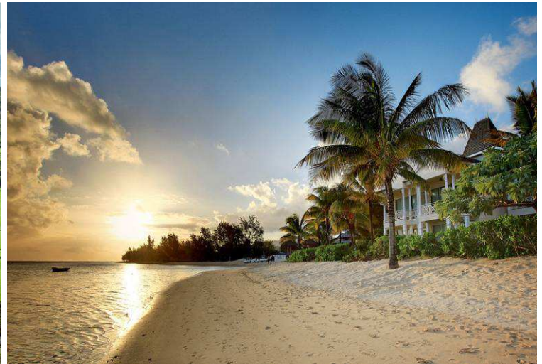
Heritage Le Telfair Resort